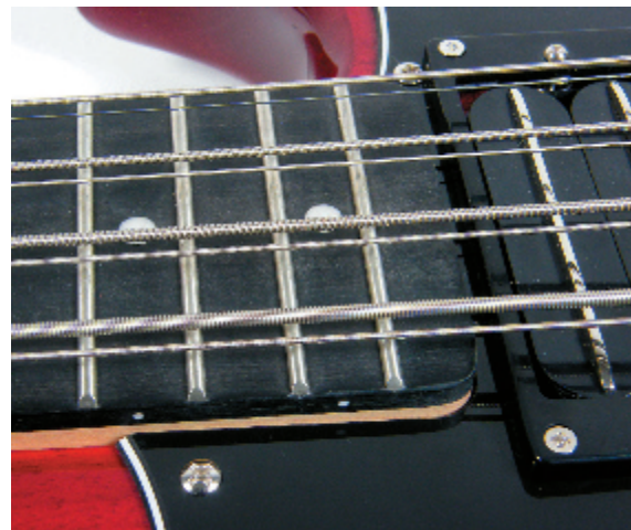
Das Resinatorwood-Griffbrett soll klanglich für Gleichmäßigkeit sorgen.

Auch wenn der neue Achtsaiter in vielerlei Hinsicht kein detailgetreues Abbild seines Vorgängers aus den Sechziger ist, hat man doch die typischen Hagström-Merkmale erfasst. Dazu gehört neben der eigensinnigen Optik vor allem die kurze Mensur und das ungemein schlanke Halsprofil, welches es auch ungeübten Spielern leicht macht, die acht Saiten entspannt zu beherrschen. Auch die Sound-Variabilität durch den sechsstufigen Pickup-Wahlschalter überzeugt und erlaubt es, den reichen, breiten